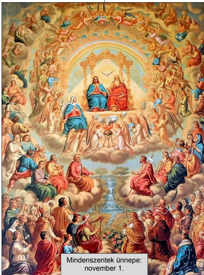
Mindenszentek ünnepe: november 1.

életet él – nincs benne buzgóság; azt teszi, amihez kedve van. – Az erkölcsi parancsokban válogat; saját maga akarja meghatározni, mi a bűn – ezt meg is fogalmazza... - Megtérésekor elkezd Istenre figyelni. Elfogadja, hogy a bűnt Isten határozza meg, nem az ember. Elfogadja, hogy a Szentírásban leírt parancsok ma is érvényesek, nemcsak a régi időkben. Vágyakozik arra, hogy Isten akarata szerint éljen. Megújítja imaéletét, életének minden területén hűséges akar lenni Isten akaratahoz – egész szívéből akarja szeretni az Urat.