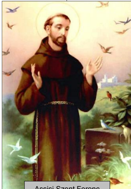
Assisi Szent Ferenc Ünnepe: október 4.

Lehetnek olyan bűnök is, amelyeket elkövetésük idején nem tartottunk bűnnek: például abortusz; házasságon kívüli kapcsolat; lopás; okkult cselekedetek; jóslás stb. – Mivel nem gyóntuk meg, nem is lettek feloldozva, nincsenek elrendezve – valamilyen formában bennünk vannak még mindig. – Azért, mert jó, ha 20-30 évenként összefoglalva újra letesszük életünk botlásait, mielőtt az Úr elé járulunk, ahol mindenről be kell számolnunk; ott lesz majd csak igazi életgyónás! – Itt kell megemlítenünk, hogy milyen nagy kockázatot vállal az az egyén – adott esetben a család is, aki nem él a jószágos Isten által „ingyen” biztosított lehetőséggel! – Halogtatja nem ritka esetben egy életen át a magábaszállást, lelkének felkészítését – sőt lehet, hogy még az utolsó, döntő pillanatban is! – A jól és idejében végzett szentgyónás „ alkalmat ad arra,