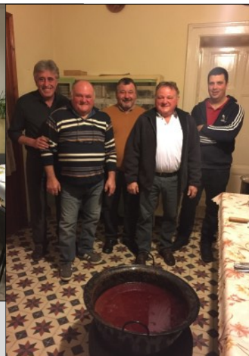
Vendéglátás a közösségi házban. Köszönjük szépen a sok segítséget és felajánlást, amiből megvalósulhatott református testvéreink megvendéglése.