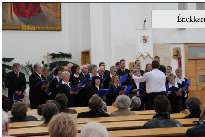
Énekkarunk éneklés közben