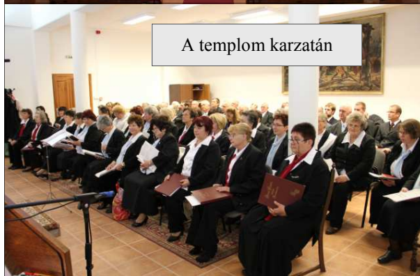
A templom karzatán