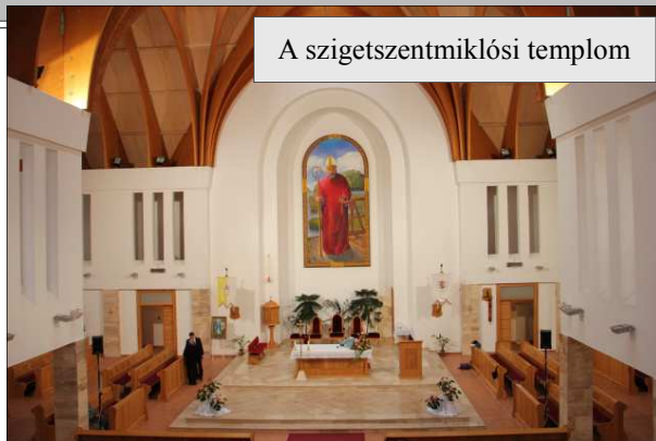
A szigetszentmiklósi templom