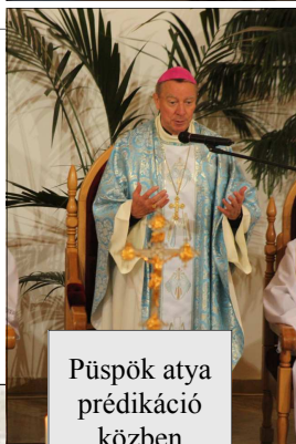
Püspök atya prédikáció közben