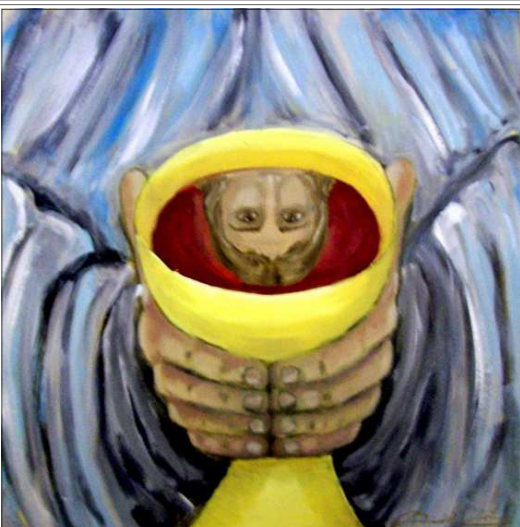
„Vérem kelyhe” — Ifj. Bircsák János festménye