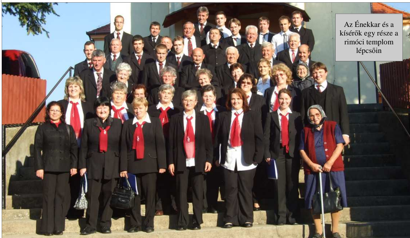
Az Énekkar és a kísérek egy része a rimóci templom lépcsőin