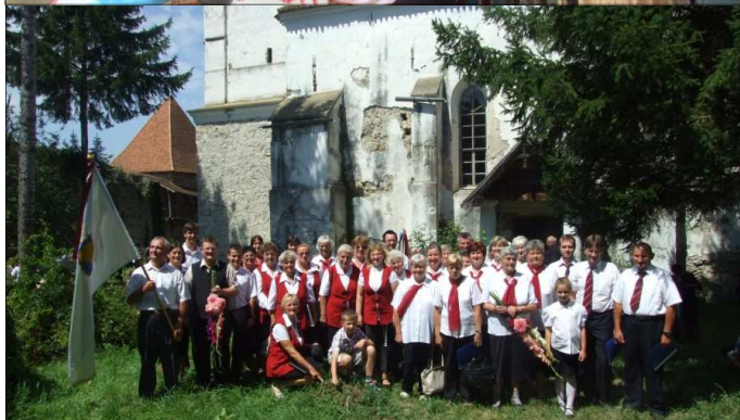
A „némedi összkar”: a református- és a katolikus kórus