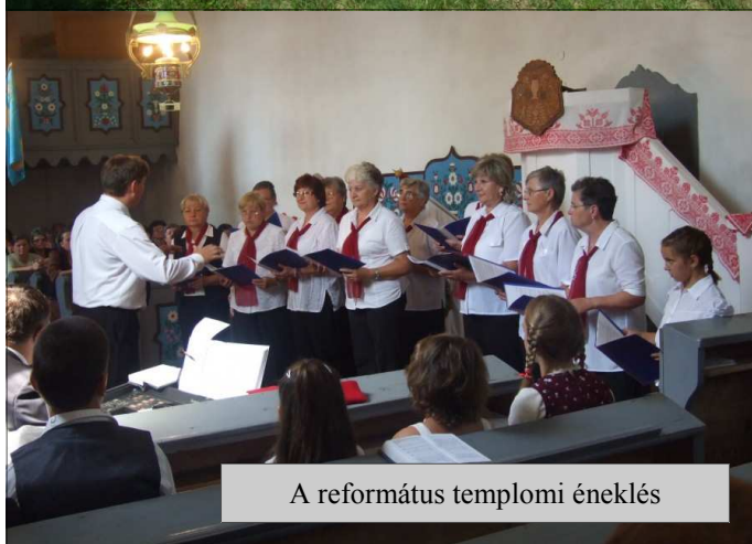
A református templomi éneklés