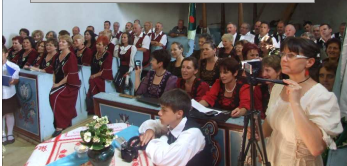
A kórustalálkozó alkalmával közös éneklés az unitárius vártemplomban