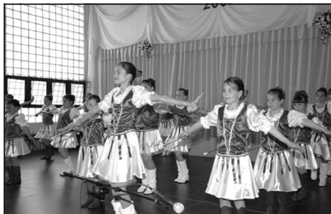
Széchenyi Napok 2007