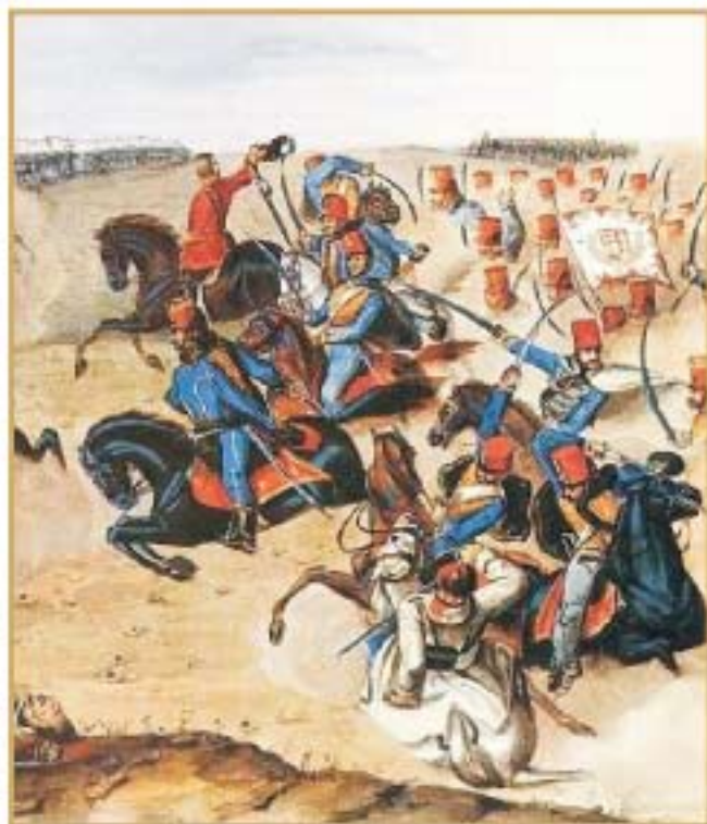
Than Mór: A komáromi csata - Görgey rohamra vezeti a Hannover-huszárokat