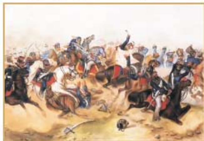
Than Mór: A tápióbicskei lovasroham