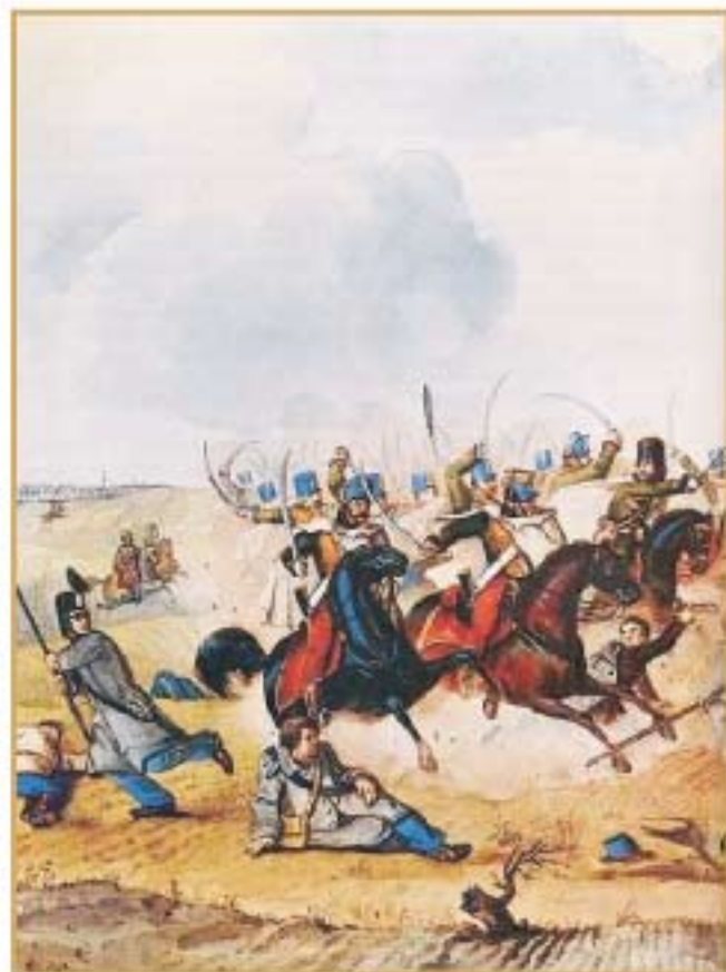
Than Mór: A kápolnai csata - elől a Sándor-huszárok