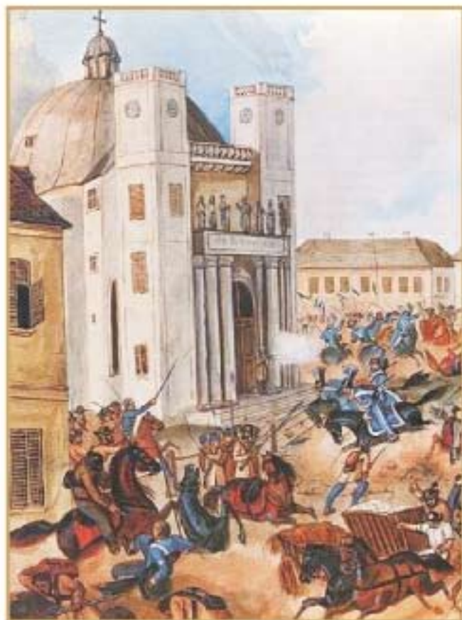
Than Mór: A váci csata - Görgey Ármín bekerített gyalogságát megmentik a Hunyadi-huszárok

E szavak dacára – rögtön rá egy lövés egyik huszár pisztolyából, s a jövevény lovának orsószzerű visszaperdülése – egy pillanat műve volt. Az orosz ekkor egészen lelapult felsőtestével a lova nyakára, és jobbajában pisztolyát hátraszegve (de ő nem lőtt!), mint az agár vagy párdac, oly gyorsan menekült vissza a szödi szőlők felé; – tőlünk két huszártiszt s e közhuszár hajrá! Utána. De hasztalan! Nem bírták utolérni; vele versenyt futni sem. Izgató látvány volt nekünk oldalt nézve: az eleinte csekély távolság, hogyan nőtt, szökésből szökésre, lassan, de biztosan, a lóhalálába vágatások között, míg az üldözött látogató végre eltűnt megint a szödi garadok mögött, s az üldözők is szégyenszemre lépést visszatértek.” Görgey István