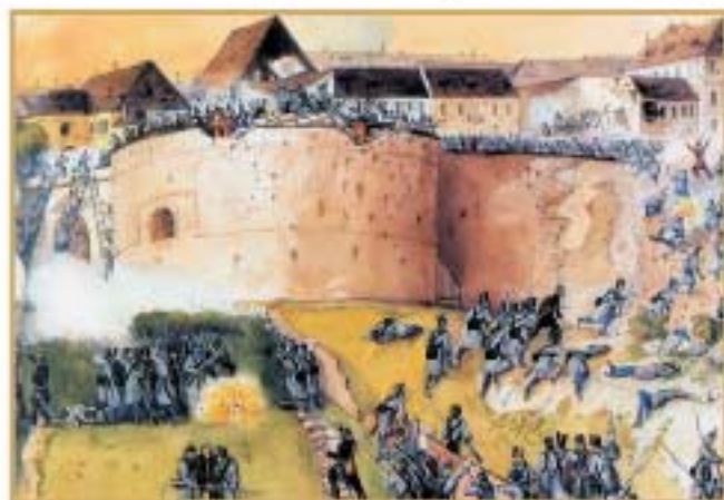
Than Mór: Budavár bevételé