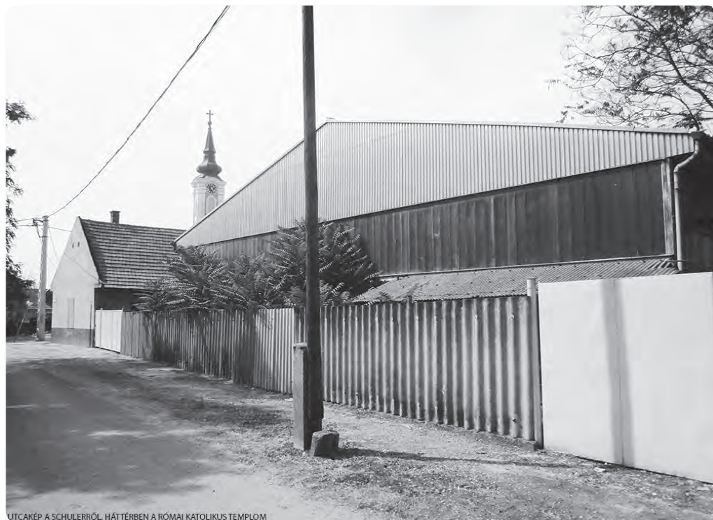
UTCAKÉP A SCHULLERRŐL. HÁTTERBEN A RÓMAI KATOLIKUS TEMPLOM