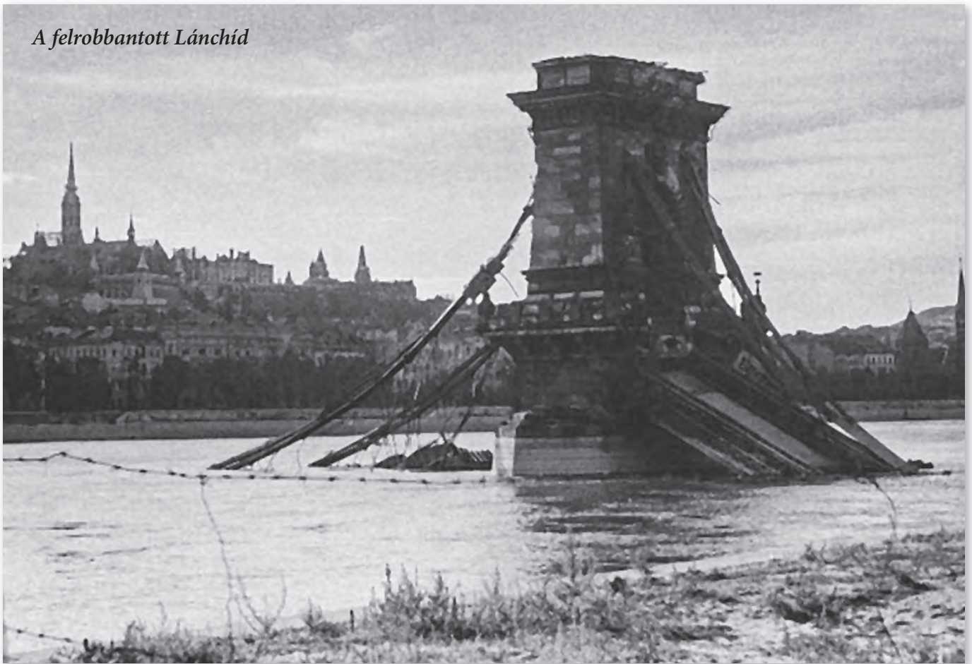
A felrobbantott Lánchíd

A magyar főváros ostroma a II. világháború egyik leghosszabb és kimondani is nehéz, legvéresebb városostroma volt. Budapest stratégiai helyzetbe került a világháború vége felé, ugyanis a Bécs előterébe, majd onnan tovább, a hőn óhajtott Berlin felé tartó szovjet hadseregeknek át kellett kelnie a Dunán. A német hadvezetésnek, miután feladta a Balkánt, a lengyel területeket a még védelmeszt Magyarország területén kellett feltartóztatnia a szovjeteket. A székesfőváros határában az első orosz tank megjelenése és a budai Vár elfoglalása között 102 nap telt el. Ezzel szemben a német főváros Berlin két hét, Bécs hat nap alatt esett el, Párizs, Róma és még néhány európai főváros Varsó kivételével nem is vált hadszínterré. A legkitartóbb német helyőrségek, mint a königsbergi vagy breslaui 77 illetve 82 napig álltak ellent a rettentő túlerőben lévő ostromlóknak. A budapesti csata 1944. október 29-től 1945. február 13-ig tartott, az ostrom ezen belül ötvenegy napig zajlott.