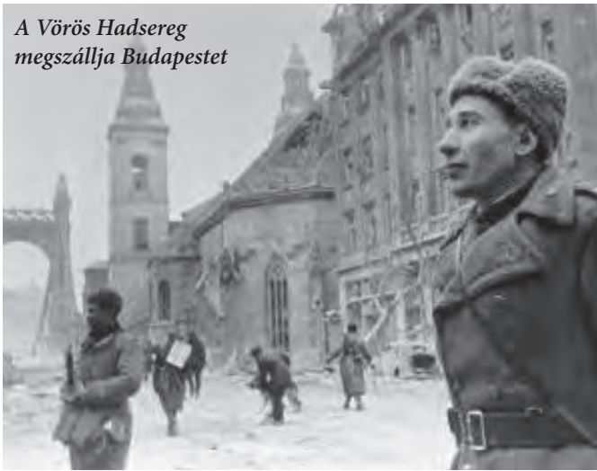
A Vörös Hadsereg megszállja Budapestet

ból önkéntes rohamzászlóaljat szervez. Ez a zászlóalj védte Budapest erőd legexponáltabb helyeit.