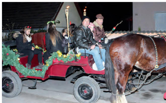
Megjött a Mikulás