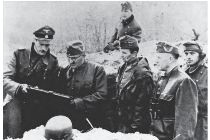
A német és a magyar haderő egyezett a főváros védelméről

re százezrek lakásává váltak. Az óvóhelyek lakói között a fő konfliktusok a főzés, vízfordás, mosás körül alakultak ki. A vízellátás megszűntével a vécék használatának is vége szakadt, ahol mégis használni próbálták, néhány nap alatt fojtogató bűzt árasztottak a kiszáradt csatornáknak.