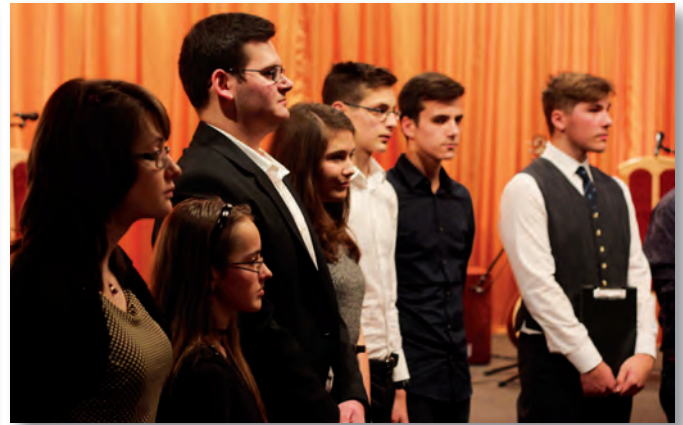
Fiatalok Adventi Koncertje