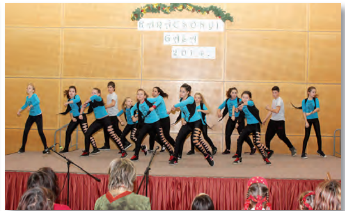
Karácsonyi Gála 2014.