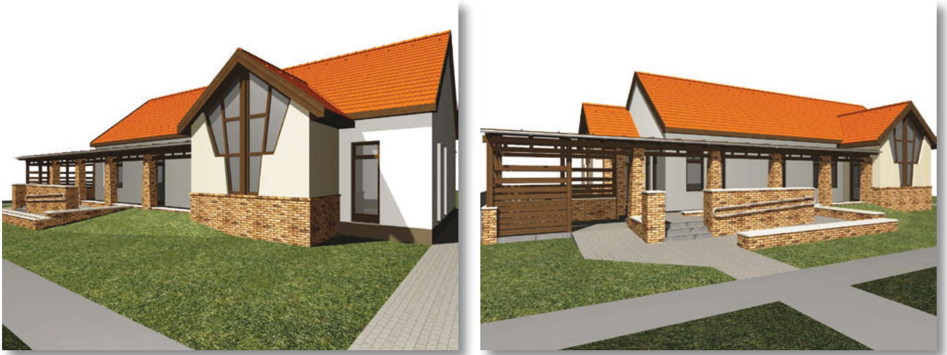
Gyermekorvosi rendelő és védőnői szolgálat