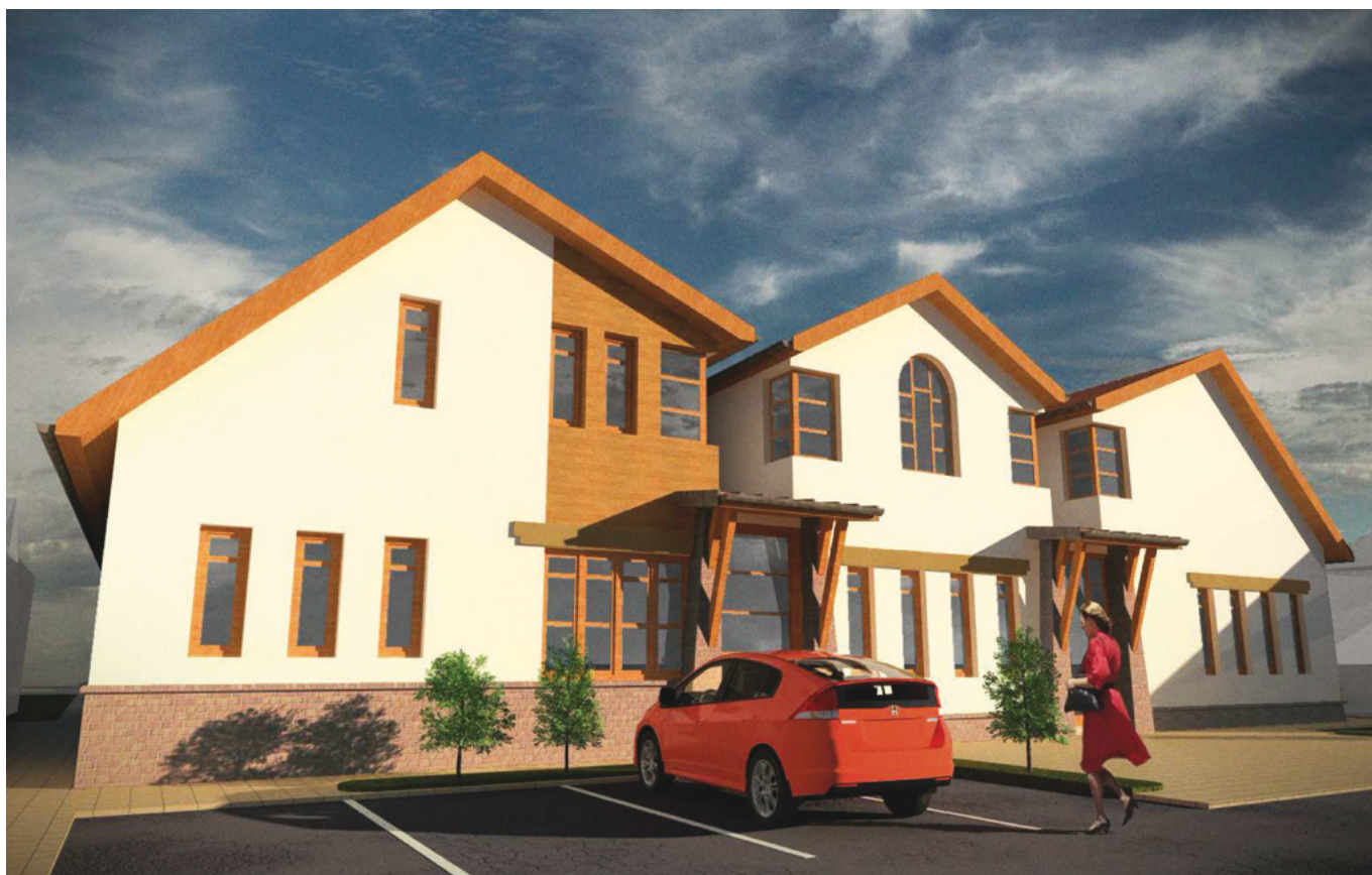
A Művelődési Ház Vörösmarty utca felőli frontja