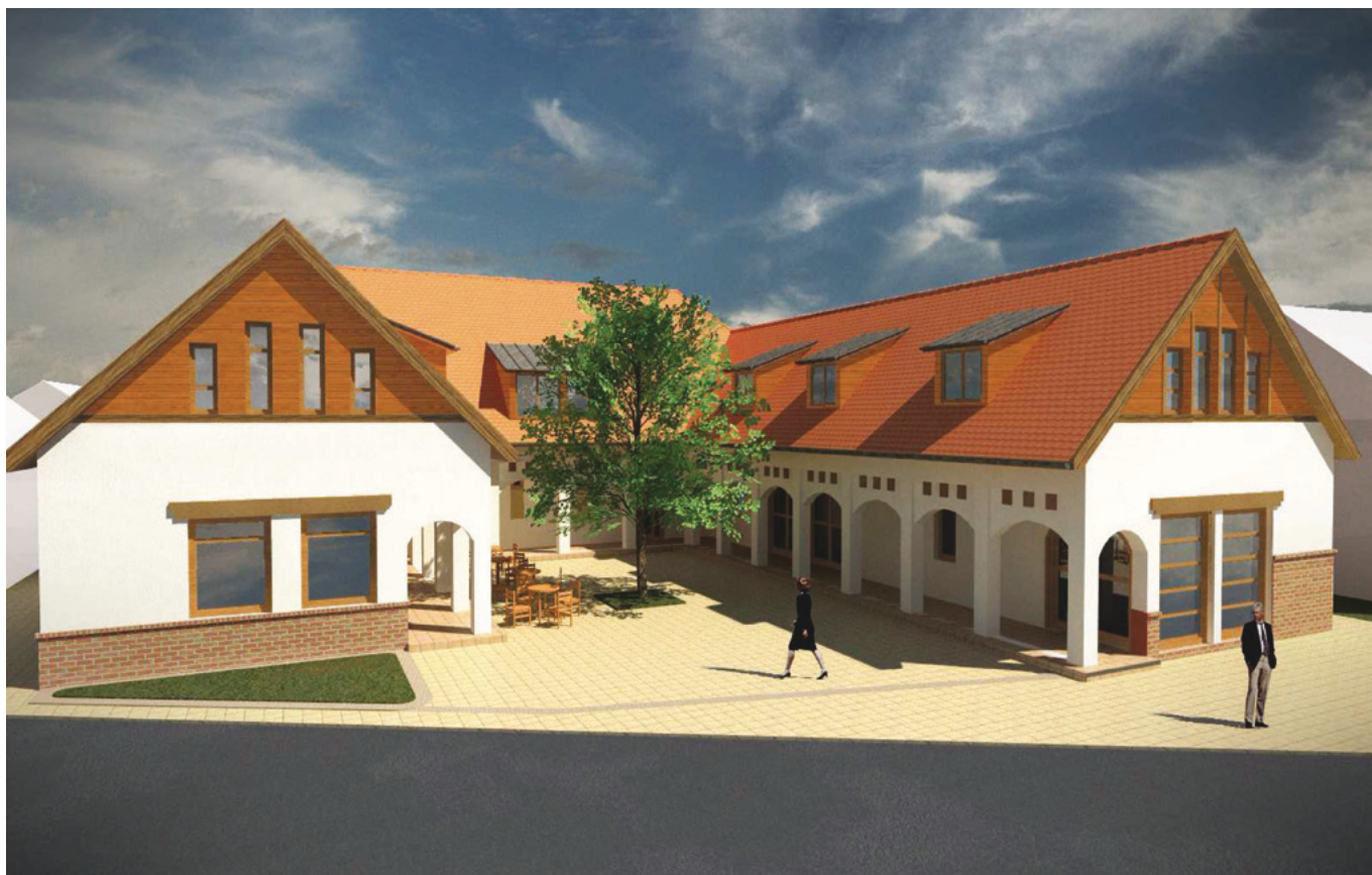
Látványkép a Dózsa György tér felől