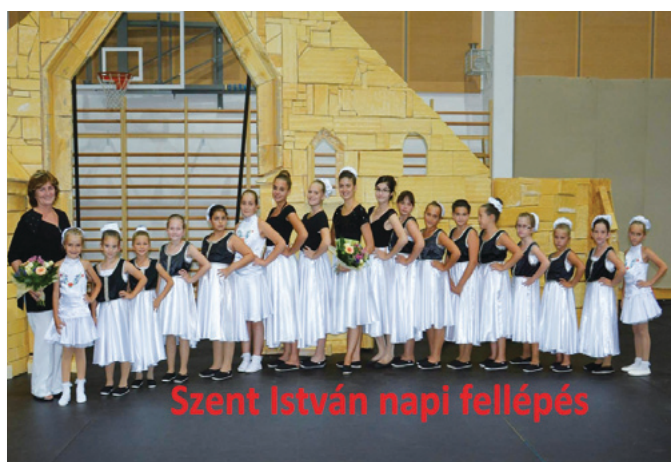
Szent István napi fellépés