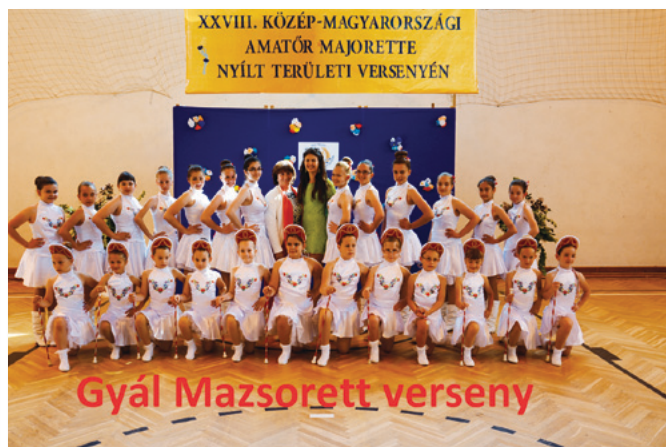
Gyál Mazsorett verseny