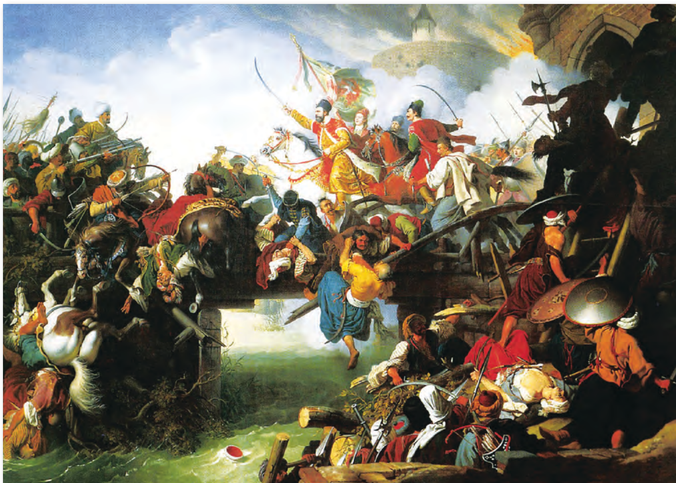
Johann Peter Krafft: Zrínyi kirohanása

Sziget belső várát"! Rögvest kiderült, hogy nemcsak ijesztgetésről van szó, mert a pontosan célzó anatóliai tüzezek, egy török szemtanú megfigyelése szerint „a belső várnak [...] kőbástyáit és harangos tornyát lövöldözték”. A török fővezér ágyútűz fedezete alatt augusztus közepén töltést építtetett a vízrendszeren át, előrenyomult a vár tövéig, sőt „a rohamhoz hágcsókat készített, akna-ásáshoz fogott”. A török ágyúk már halálos veszéllyel fenyegették a várat, ezzel egyidejűleg véres harcra kényszerítették az Óváros őrségét. Az ostrom ekkor már a nagyvezír elképzelése szerint folyt, de a vártnál lassabban, és igen nagy veszteséggel. A közelharc az Óváros bástyáinál és kapuinál bontakozott ki. A szigetvári harcosok példátlan heveséssel védekeztek. Réslövés, aknaásás és sok-sok roham ellenére kitartott az Óváros őrsége, és óriási veszteségeket okozott a törököknek, köztük a janicsároknak. A végsőig tartó küzdelem miatt az óvárosiak jelentős részének nem sikerült a városba húzódnia, mert a kiürítést későn, augusztus 21-én rendelték el, ezt