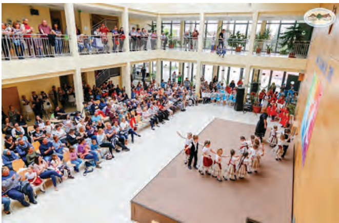
Ismét megtelt az AULA A Tánc Világnapján