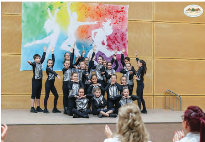
Vendégünk volt az ócsai Energy Kids Táncsoport