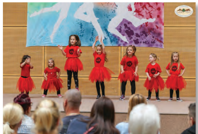
A Starlight legkisebb táncosai