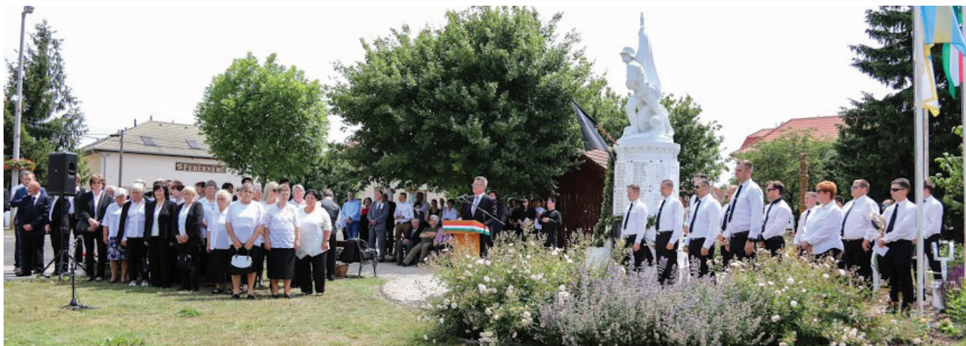
ÍGY EMLÉKEZETT ALSÓNÉMEDI LAKOSSÁGA TRIANON 100. ÉVFORDULÓJÁRA