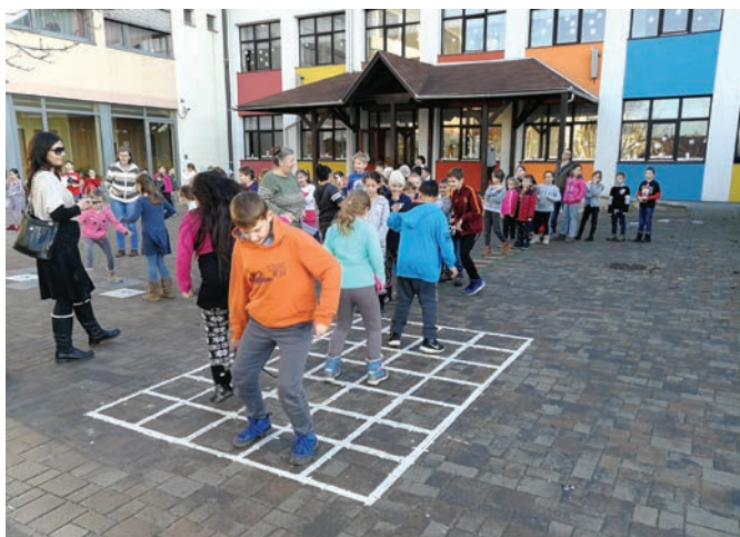
Új játékok az udvaron

Sok munkával, hosszú évek alatt sikerült elérnünk az ÖRÖKÖS ÖKOISKOLA címet, mely az éves munkatervünkben számos programhoz kapcsolódik. A környezettudatosságra nevelés az egész éves nevelő-oktató munkában is jelen van.