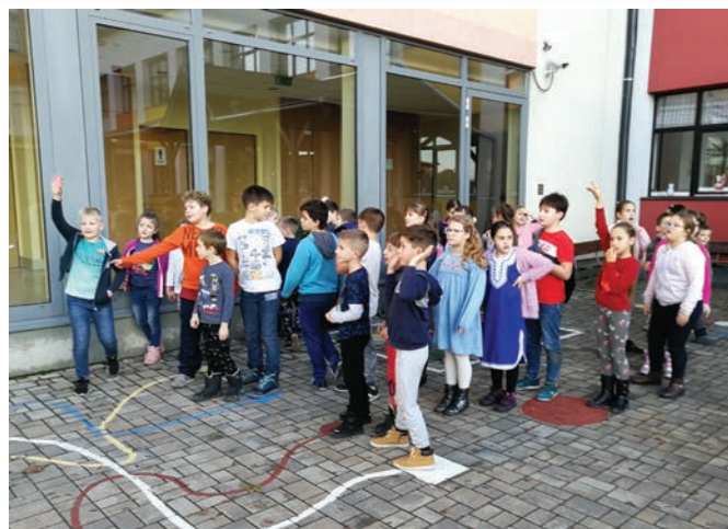
Akadályverseny a napköziben

Az őszi szünetben az iskola udvarára látványos, csoportos mozgásra is lehetőséget adó játékokat festettünk. Kicsik és nagyok azonnal birtokba vették, nagy örömkre sokat játszanak az új helyszíneken.