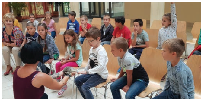
Sünióra az Állatok Világnapján

dést az Alsónémediért Közalapítvány szervezésében a „Becsöngettek, fussunk!” futóversennyel ünnepeljük. Az éppen iskolába lépő elsősök, nagy nyolcadikosok, alsósok és felsősök ugyanazzal a lelkesedéssel vesznek részt a versenyen, várják az eredményhirdetést.