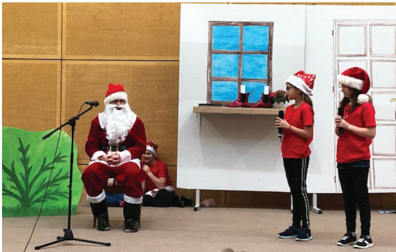
Megjött a Mikulás!