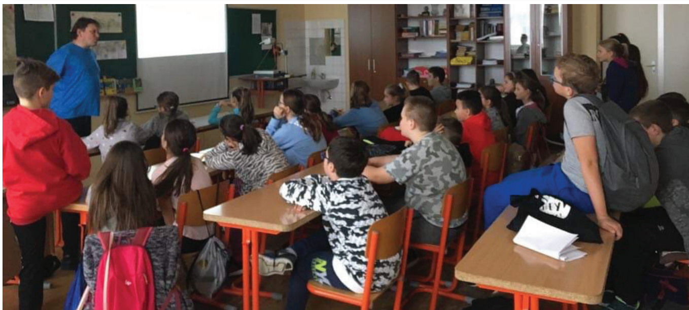
Előadás az Egészségnapon

iskolák képviselői tartottak kedvesináló tájékoztatót a felsősöknek. Lelkes szülők mutatták be foglalkozásukat az alsósoknak.