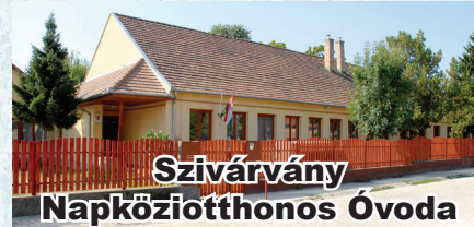
Szivárvány Napköziotthonos Óvoda