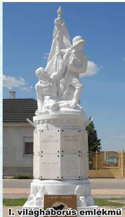
I. világháborús emlékmű