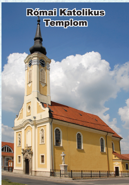
Római Katolikus Templom