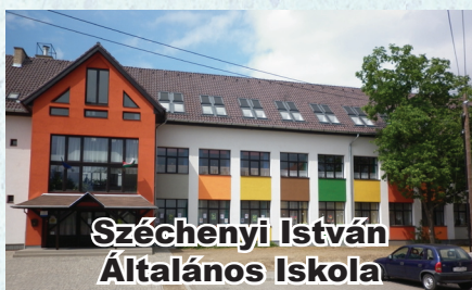
Széchenyi István Általános Iskola