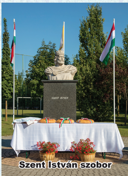
Szent István szobor