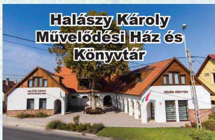
Halászy Károly Művelődési Ház és Könyvtár