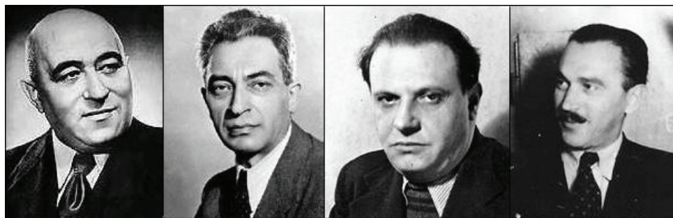
1956 előtt Magyarország teljhatalmú urai: Rákosi Mátyás, Gerő Ernő, Farkas Mihály és Péter Gábor

A harmadik előzmény a lengyelországi események