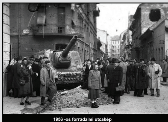
1956-os forradalmi utcakép