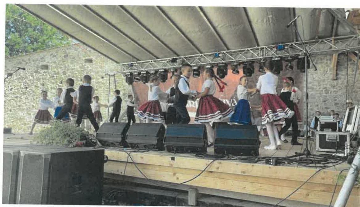
Sepsiszentgyörgyi Művészeti és Népiskolának nagyjaitai táncosai