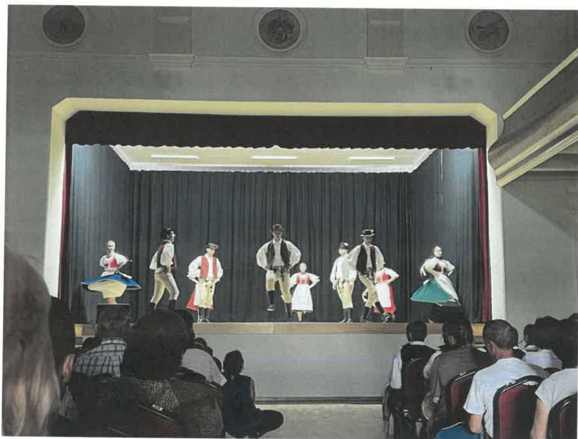
Sepsiszentgyörgyi Művészeti és Népiskolának nagycsoportja