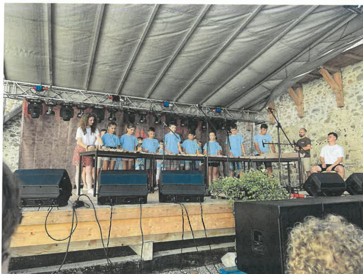
Sepsiszentgyörgyi Művészeti és Népiskolának nagyjait citerásai