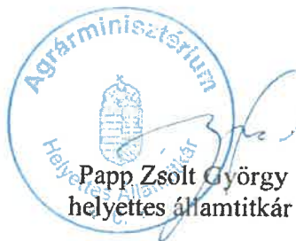
Papp Zsolt György helyettes államtitkár